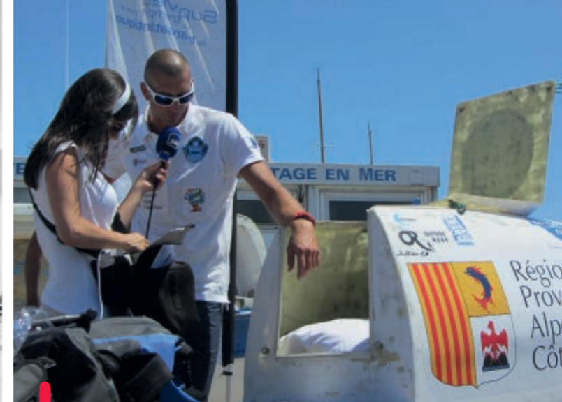
Frankrijk is bij uitstek het land dat maritieme recordjagers voortbrengt.

natte doekjes per dag voor zijn gezicht en zo nodig zoet water dankzij twee pompen en een watermaker.